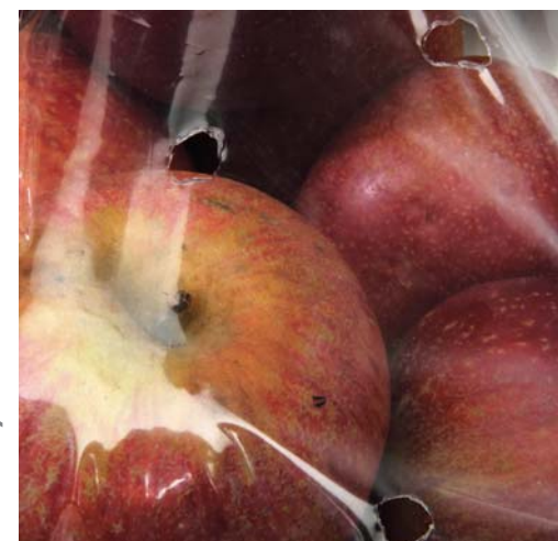
FRUTTA / POLIETILENE FORATO FRUITS / PERFORATED POLYETHYLENE