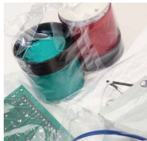
RICAMBI / POLIETILENE SPARE PARTS / POLYETHYLENE