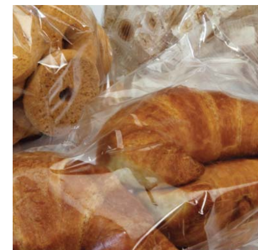
DOLCI DA FORNO / CAST CONFECTIONERY / CAST