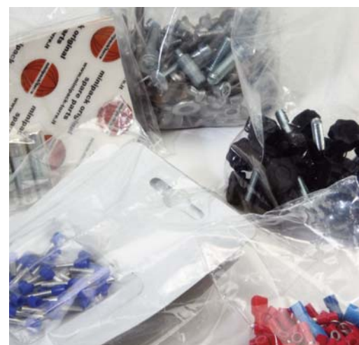
MINUTERIA / POLIETILENE MINUTIA / POLYETHYLENE