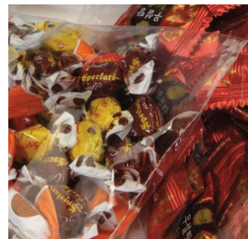
DOLCIUMI / POLIETILENE CANDIES & SWEETS / POLYETHYLENE