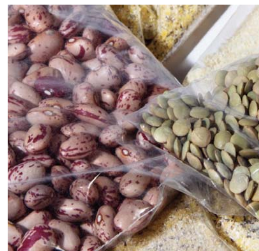
FARINE E GRANULARI / POLIETILENE FLOURS & GRANULAR PRODUCTS / POLYETHYLENE