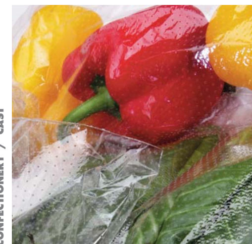
ORTAGGI / MACROFORATO VEGETABLES / MACROPERFORATED