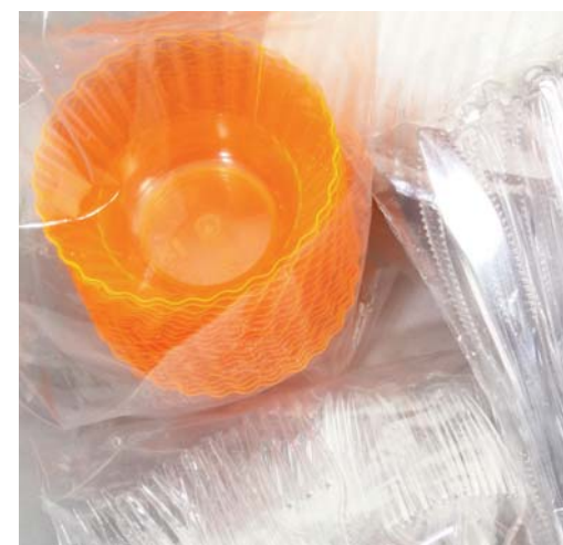
MONOUSO / POLIETILENE DISPOSABLE / POLYETHYLENE