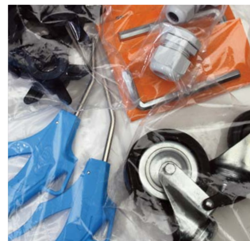
FERRAMENTA / POLIETILENE HARDWARE / POLYETHYLENE