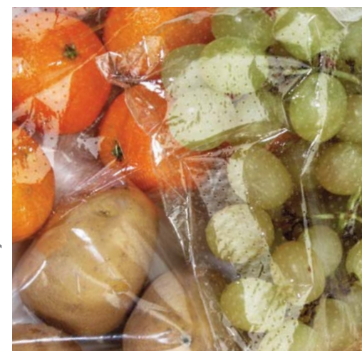
FRUTTA / MACROFORATO FRUITS / MACROPERFORATED