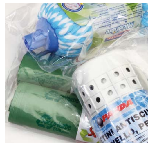
CASALINGHI / POLIETILENE HOUSEWARE / POLYETHYLENE