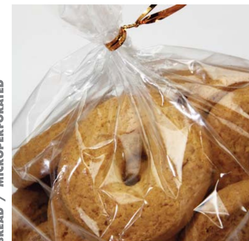
BISCOTTI / CAST BISCUITS / CAST