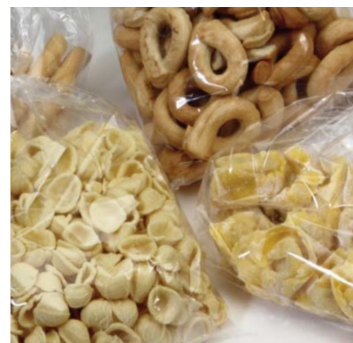
PRODOTTI TIPICI / CAST REGIONAL PRODUCTS / CAST