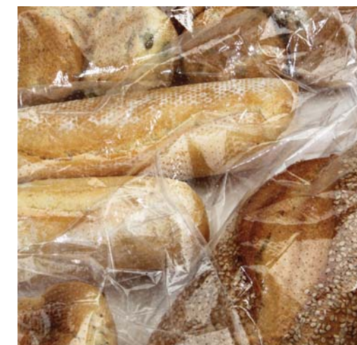
PANE / MICROFORATO BREAD / MICROPERFORATED